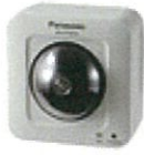
ネットワークカメラ(BB-SW175A)